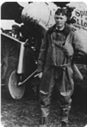
Charles A. Lindbergh 찰스 린드버그 (1902.2.4-1974.8.26)

세계 최초로 대서양을 무착륙하여 뉴욕으로부터 파리까지 단독비행을 한 인물이다. 그의 행동은 lone eagle이라는 칭호를 얻게 하여 미국인들이 개척정신의 상징으로 인식되는데 큰 공헌을 하였으나 2차 대전이 일어날 무렵 그는 미국의 전쟁 개입을 극구 반대를 하였다. 그러나 진주만 사건으로 생각이 바뀐 린드버그는 40이 다 된 나이에 자원입대를 하였고 미 공군의 비행실력에 상당히 큰 공헌을 하였다. 전쟁이 끝난 후 아이젠하워 대통령으로부터 장군으로 승격 받았고 그의 저서 'The Spirit of St. Louis'는 풀리처상을 수상하였다.