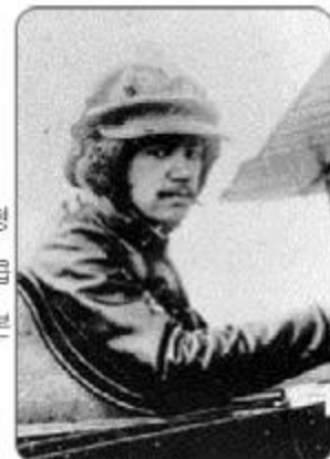
Igor I. Sikorsky 이고르 아이반 시코르스키 (1889.5.25~1972.10.26)

러시아 태생의 미국 항공 기술 발명가였다. 세계 최초의 4발 대형기를 설계 제작 후 미국으로 망명하였으며 1939년부터는 헬리콥터 설계를 시작하여 1941년에 비로소 오늘날의 헬리콥터의 기본 형식을 완성하였다.