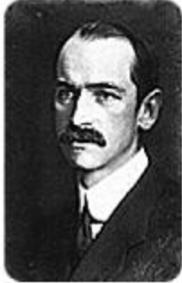
Glenn H. Curtiss 글렌 커티스 (1878.5.21~1930.7.23)

뉴욕주의 해먼즈 포드에서 출생하였으며 1904년 연식 비행선 캘리포니아 애로우용 발동기의 제작 설계를 담당했다.