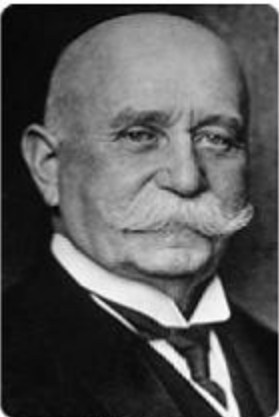
Ferdinand von Zeppelin 펠디난트 폰 체펠린 (1838.4.8-1917.5.8)

오늘날 비행선의 모태가 된 체펠린호를 발명한 체펠린은 기체 비행선의 근원을 성립하였다. 그의 최후 작인 힌덴부르크호는 선체길이 245m 직경 41m의 어마어마한 크기를 자랑하며 뒤쪽의 프로펠러에 의해 추진력을 제공받는 형식이었다. 1차 세계대전 당시에는 영국을 폭격하는 무기로 사용되었고 대서양 횡단과 세계 일주 비행에도 성공하였으나 1937년 뉴욕착륙 직전의 공중 폭발 사건으로 인해 비행선의 개발이 중지되었다.