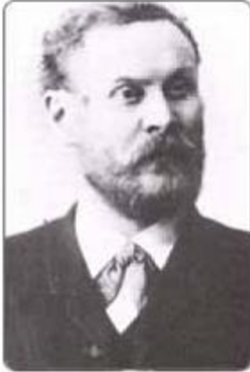
Otto Lilienthal 오토 릴리엔탈 (1848.5.23-1896.8.9)

근대 비행기 탄생의 선구자로서 글라이더를 발명하여 비행기 발달에 위대한 공헌을 한 사람이다. 베를린 직업학교를 졸업 후 새의 모습을 기초로 하여 18가지의 글라이더를 발명하였으며 2000회 이상의 비행실험을 하였다. 1896년 시험비행을 하던 도중 강풍을 만나 추락하여 중상을 입고 사망을 하였으며 그의 사망은 라이트 형제에게 동력비행의 원인을 제공하였다. 그가 남긴 업적은 그에 의해 활공비행을 이루었으며 비행기 탄생의 문을 열어준 사람이라고 해도 과언이 아니다.