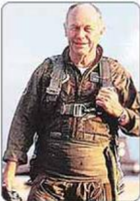
Charles E. Yeager 찰스 에드워드 예거 (1923.2.13~)

세계 최초로 음속을 돌파한 미 공군 파일럿 예거는 2차 세계대전에 참전하여 13기의 적기를 격추시켰고 전후에 시험 비행사로 활약하였다. 1947년 그는 주위의 마하의 이론에 대항하여 당당히 음속 비행기에 도전하였고 그의 불굴의 도전정신으로 마하 1.35의 속도로 비행을 하였으나 기내 자체 결함으로 비행기는 폭탄처럼 터지고 다행히 탈출에 성공하였다. 죽음을 두려워하지 않는 도전의 식으로 마하에 도전한 예거는 오늘날의 항공 산업을 이끈 위대한 인물이다.