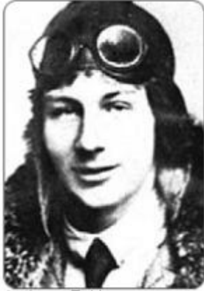
Anthony Fokker 안토니 포커 (1890.4.6~1939.12.23)

인도네시아의 부유한 커피 재배자의 아들로 태어나 20세에 이미 자가용 비행기를 만들 수 있었다. 1917년 국제 비행기 면허를 취득하고 베를린 근처에서 회사를 차려 군용항공기 설계 경쟁에 입찰하였다. 그는 곧 독일 정부의 사업자로 선정되었고 3년간 비행사 훈련도 도맡는 계약을 체결하였다. 1차대전 이전에 약 40여종의 항공기를 제작하였으며 프로펠러 전면 직사기 총발사 장치를 고안하여 세계 최초의 전투기 '포커 E1형기'를 제작하였다. 전쟁이 끝난 후 암스테르담으로 옮겨 '네덜란드 항공기 제작소'를 설립, 수송기를 제작하였다. 이 수송기는 세계적인 명성을 얻어 이를 사용하는 업체가 45개 이상 되었다. 이후 미국으로 건너가 애들랜틱 항공기회사를 설립하였으나 곧 명칭을 아메리칸 포커로 개정하였