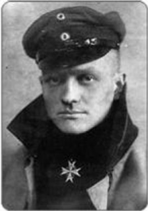
Baron Manfred von Richthofen 만드레드 폰 리흐토벤 (1892.5.2~1918.4.21)

1차 대전을 통틀어 가장 위대한 조종사로 칭송받는 리흐토벤은 세상 사람들에게 전설로 남았다.