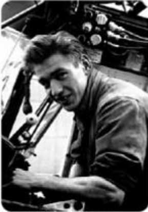
Will E. Messerschmitt 윌리 에밀 메셔슈미트 (1898.7.26-1978.9.15)

그는 14살에 첫 글라이더를 만들었고 3년 뒤 날수 있는 구조를 디자인하였다. 비행기 설계에 관심이 많았던 그는 메셔슈미트 비행기 제작소를 설립하여 독일 항공 우주산업의 리더가 되었으며 38년 바이에른 항공기 제작사와 합병, 2차 대전 동안 독일 공군을 위해 약 35000대의 ME BF-109를 생산하였다. 전쟁이 끝난 후 약 2년간 미군에게 억류당해 재봉틀을 생산하였으나 58년 다시 항공기 제작을 시작하여 70년대에는 약 2만 명의 직원을 거느린 인공위성, 헬리콥터, 미사일, 항공기 제작사가 되었다.