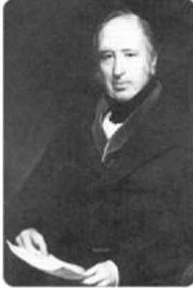
Sir George Cayley 조지 케일리 (1773.12.27-1857.12.15)

영국 요크셔 스카버리에서 태어난 조지 케일리는 항공사상 최초로 생명력 없이 움직이지 않는 날개를 가진 비행기계의 과학적인 기초 원리를 확립하는데 절대적으로 공헌을 한 사람이다. 비행기의 이론적, 실험적 연구로 날개를 움직여 비행하려 했던 다빈치의 연구로는 비행이 불가능하다는 것을 깨달은 그는 몽골피에 형제의 기구비행에 자극을 받아 고정된 날개를 일정한 속도로 전진시키면 날개에 양력이 발생하여 공기보다 무거운 비행기계를 뜨게 할 수 있다는 고정익 비행기의 기초적인 원리를 밝혀냈다. 이러한 그의 연구는 훗날 1세기 후에 라이트 형제가 인류 최초의 동력비행에 성공하는 터전을 마련했고 또한, 비행기의 아버지라 불리게 하였다. 그는 글라이더를 최초로 비행시킨 사람이며 가동익이나 상반각 등의 효과에 대한 이론을 수립하였고, 저항의 감소를 위해 비행기 각부의 모양을 유선형으로 설계하는 것이 중요하다고 주장하였다. 또한, 비행선의 설계를 발표하고, 항공기 추진용 가스기관과 열 공기기관의 실험을 하기도 하였는데 1799년 접시에 그린 고정익 비행기계, 1843년 두 꼬리날개를 가진 증기 동력 비행기 "Aerial Carriage", 1849년 3겹 날개 글라이더, 1953년 조종 가능한 새로운 글라이더 등이 바로 그것이다.