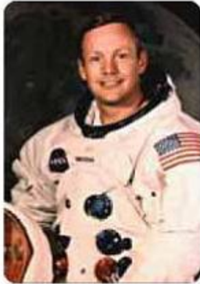
Neil A. Armstrong 닐 암스트롱 (1930.8.5~)

미국 퍼듀 대학교에서 항공학을 전공한 후 해군비행학교로 진학하여 6·25전쟁 중 해군전투조종사로 78회 출격하였다. 훗날 미국 항공우주국(NASA)에 들어간 그는 1962년 미 항공우주국(NASA)의 제2기 우주비행사로 선발된다. 1966년 3월에는 제미니 8호의 선장인 D.R.스콧과 함께 첫 우주비행을 하여 아제나 위성과 최초의 도킹에 성공하였다. 어려서부터 비행기를 좋아한 닐 암스트롱은 16세 때 이미 비행기 조종사 자격증을 취득하였다. 후에 퍼듀 대학교에서 항공학을 전공하여 비행기에 대한 연구를 이어온 그는 졸업 후 해군비행학교에 진학한다. 6·25 한국전쟁 당시에는 제트기 조종사로 78회 출격하였고, 1962년에는 항공 및 우주의 연구개발을 목적으로 미 항공우주국(NASA)에 제2기 우주 비행사로 선발되었다.