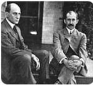
Wilbur and Orville Wright 라이트형제 (1867.4.16-1912.5.30 / 1871.8.19-1948.1.30)

1892년 자전거 회사를 시초로 오토 릴리엔탈의 죽음에 충격을 받고 비행기를 제작하기에 이르렀다.