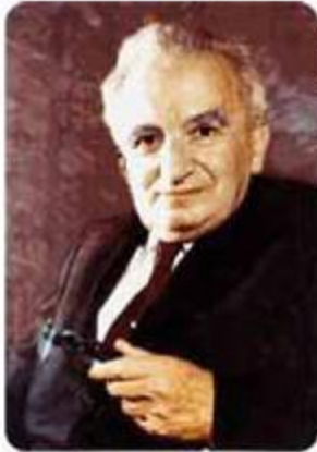
Theodore von Karman 데오헬 폰 카르만 (1881.5.11~1963.5.6)

유체역학 연구의 선구자로서 아헨 공과대학과 캘리포니아 공과대학을 설립하였다. 주요 업적으로 카르만의 소용돌이의 안정성(1911), 마찰저항의 이론(1930), 역학적 상사에 따른 난류 이론(1938), 천음 속상사법칙(1947) 등의 연구가 있다.