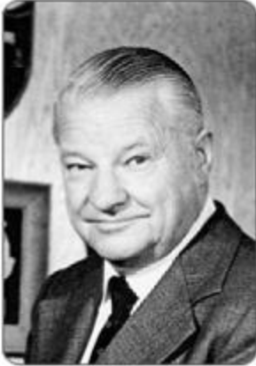
Clarence L. Johnson 클라렌스 존슨 (1910.11.27~1990.12.21)

이미 젊었을 때부터 항공기 산업분야에서 인정받기 시작한 그는 켈리라는 애칭으로 유명하다. 그가 설계한 시속 640km의 트윈테일 P-38 라이트닝은 당시의 연합군 전투기 중 최고의 성능과 디자인을 자랑하였다. 그는 미 국방성으로부터 음속 전투기 제작을 의뢰 받고 143일 만에 P-80 슈팅스타를 제작하였으며 후에 록히드 마틴사를 세웠다. 인류 역사상 가장 스타일리시하며 고성능을 자랑하는 켈리의 항공기들은 모두 스캅크 워크스의 힘으로 제작되었으며 스캅크 워크스는 켈리가 속한 팀의 이름이었다. 이후 고공 첩보기 SR-71 블랙버드를 만들었으며 이 비행기의 최고속도는 수년간 깨지지 않았다.