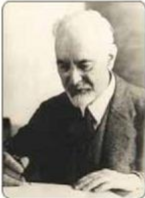
Ludwig Prandtl 루드위그 프란틀 (1875-1953)

현대의 항공역학을 이룬 루드위그 프란틀은 항공 역학과 유체역학에 누구 못지 않은 기여를 했지만 노벨상을 수상하진 못했다. 그의 업적으로는 얇은 에어포일 이론, 유한 날개이론, 초음속 충격파와 팽창파 이론, 그리고 경계층 개념의 내용 등 무수히 많다. 1930년대까지 유명한 유체역학의 원로로 인식되었던 프란틀은 구조역학과 기상학을 포함하는 다양한 분야의 연구에 많은 기여를 했고 그의 유체역학 이론은 아직도 많은 학생들이 공부하고 있다.